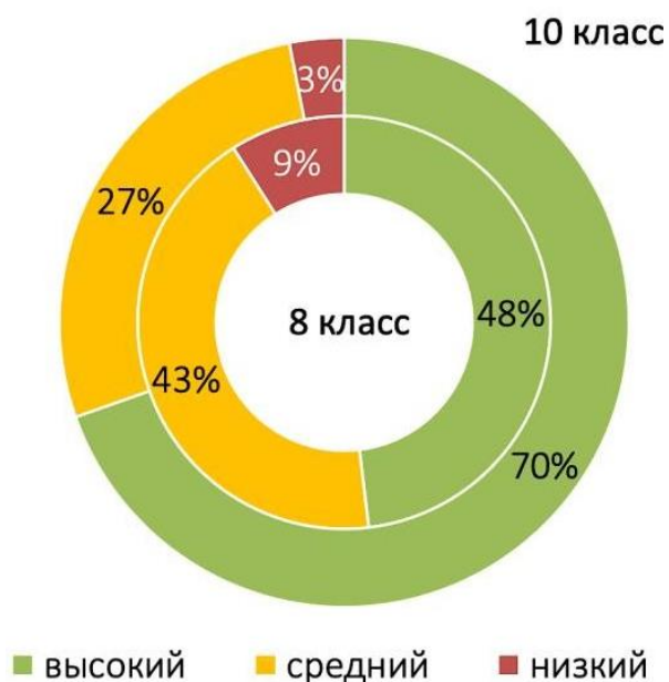
Рисунок 2. Обобщенный индекс школьного благополучия по оценкам обучающихся; результаты ОО

С одной стороны, ОО могут стремиться к созданию более комфортных психологических условий для старшеклассников. Данные НИКО показывают, что 42% классных руководителей 10-х классов работают с классом первый год (то есть назначены во вновь организованный класс); доля более опытных классных руководителей в старшей школе также несколько выше, чем в основной.