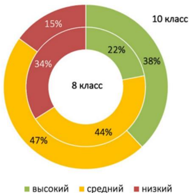
Рисунок 1. Уровни обобщенного индекса ценностных ориентаций; результаты ОО

При построении воспитательной и профилактической работы в ОО нужно учитывать, что доля ОО с низким уровнем развития ценностных ориентаций обучающихся в 8-х классах более чем в 2 раза выше, чем в 10-х классах.